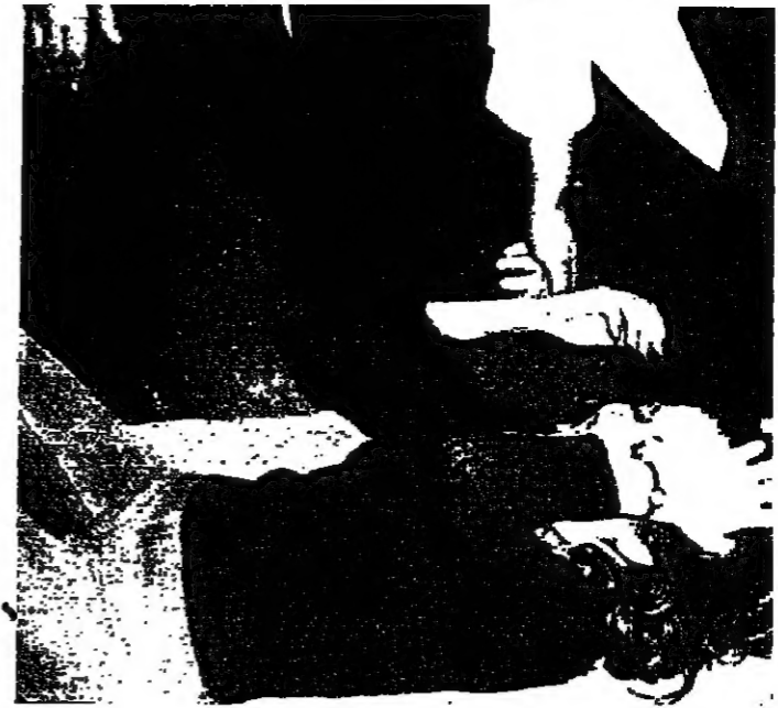
... وبدأت التجربة القاسية

خفة «المهوية» التقليدية التي يتيمها طلاب معهد الفنون في الجامعة اللبنانية، خرجت هذه السنة أيضاً من المكلف، إلى حد دفع بعدد من رجالات التربية والطلاب إلى اعتبار ما يجري خروجاً عن الخط الأكاديمي التربوي، وسخفاً يصل إلى حد لتوي بعض الطلاب أمام عدد كبير من الطلاب.